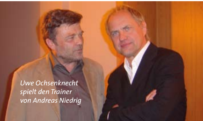
Uwe Ochsenknecht spielt den Trainer von Andreas Niedrig